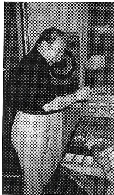
"SID EN BILLY WIE?"

BA: Met welke bekende sterren hebt U allemaal gespeeld?