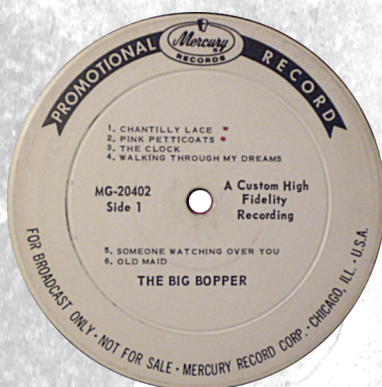
LP USA Promo

Jape had ook voor Donna Dameron de single Bopper 486609/ Big Love geschreven. Beide nummers hebben een Big Bopper-beat en op het einde van Bopper 486609 is hij zelf ook nog te horen.