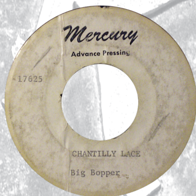
45 USA Advance pressing A